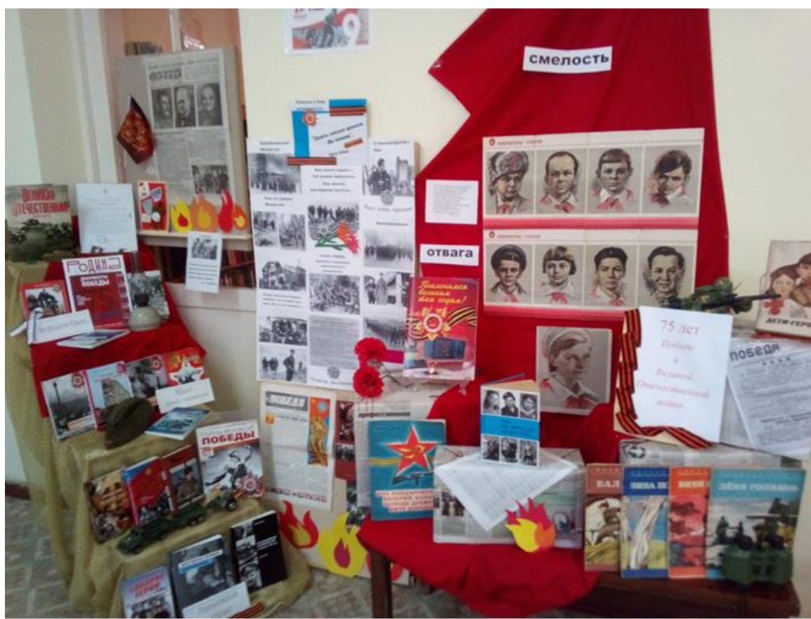
Фотозона в читальном зале библиотеки к 75-летию Победы в ВОВ